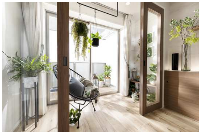
コンサバトリー空間