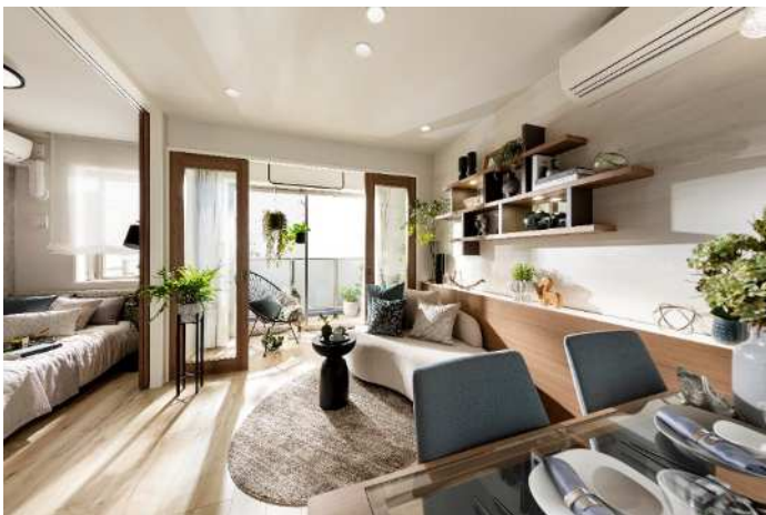
LDKとコンサバトリー