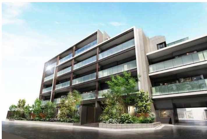
「ルピアコート花小金井」外観パース

本件に関するお問い合わせ先 ポラスグループ ポラス株式会社 コミュニケーション部 広報課 TEL:048-989-9151